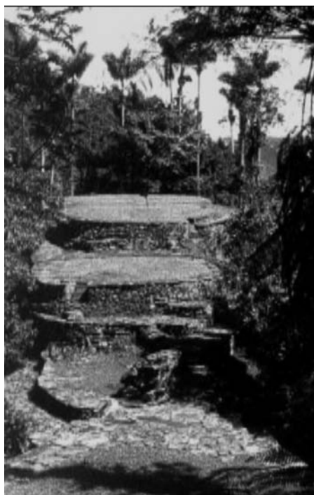
Ciudad Perdida. Territorio y Arquitectura como un todo armónico.

articular ambos conceptos y en la sumisión del territorio ante la arquitectura. La humanidad encontró en el territorio un lugar para su propia producción, lo transformó en consecuencia con a sus necesidades físicas o lo predispuso para erigir allí sus recintos habitacionales. Es probable que las civilizaciones más antiguas hayan asumido su evolución espacial como un todo integrado -baste citar como un solo y no único ejemplo, el caso de las culturas precolombinas- sin separación entre la arquitectura y el territorio. Esta separación entre la construcción del territorio y de la arquitectura se hizo mas patente con el correr de los tiempos hasta alcanzar su punto álgido con el movimiento moderno del siglo XX. La historia registra una ruptura no solamente física sino también conceptual en ambas nociones, se habla de una historia de la arquitectura por un lado y de otra historia de la evolución del territorio -siempre y cuando se asuma que realmente esta última existe-. La vuelta atrás en la visión