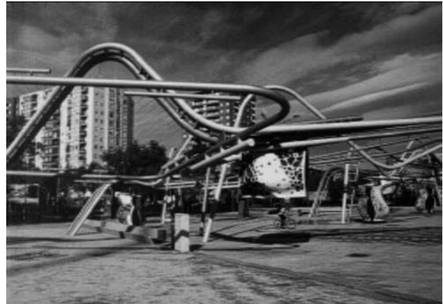
Diagonal Mar en Barcelona, Arqs. E. Miralles y B. Tagliabue Un paisaje para ahora.

el individualismo de muchos profesionales que antes de verse embebidos en grupos de trabajo pluridisciplinares prescinden de esta tendencia en favor del culto a su egolatría.