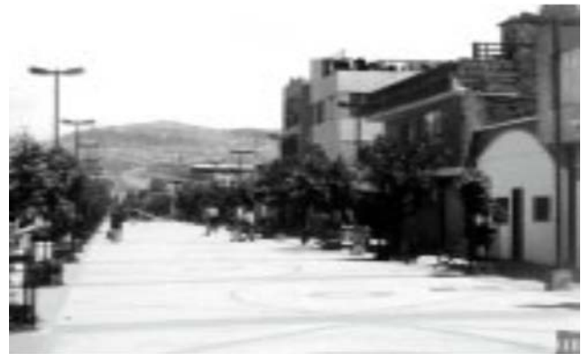
El paisaje de la ciudad, entre el diseño (en positivo) y el residuo (en negativo).

Como reacción a una configuración anómala de la ciudad del siglo XX -si se la compara con la disposición de ciudades que antaño privilegió la relación entre individuos y su espacio colectivo- surgen diversos autores que debaten la ciudad existente al momento y que proponen derroteros encaminados a redireccionar el paisaje urbano contemporáneo. 27