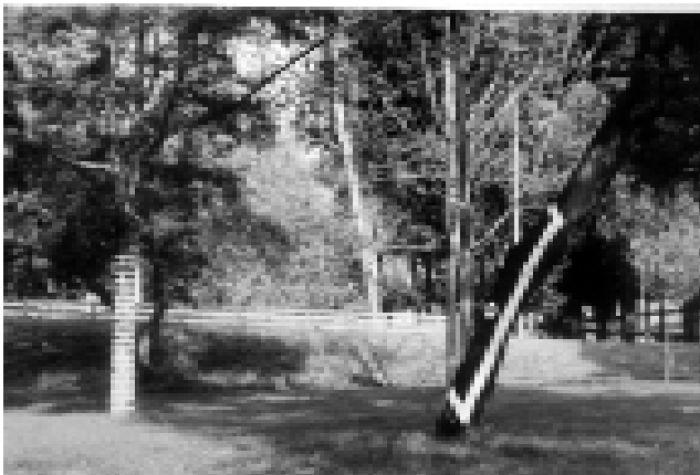
El Land Art señaló nuevos caminos para el paisaje.

Pero también el desarrollo futuro de la ciudad guarda un reto para el paisajismo: atender - como en el pasado-, aquellos vacíos que el urbanismo tradicional no ha podido ocupar. Hoy, más que siempre, la ciudad se ha diversificado y sus demandas ya no se ciñen únicamente dentro de una visión sistemática y funcional sino que se amplían hacia una visión cultural y específica más vinculada al estilo y la calidad de vida de las personas. 24