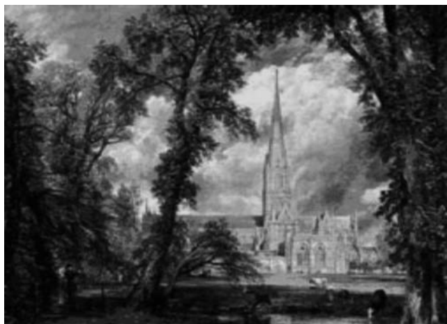
Catedral de Salisbury, de John Constable. El paisaje pictórico, siglo XIX.

paisajes reales 8 y aunque el primero de los casos señala un ideal de configuración espacial, el desplazamiento del interés de la representación al modelo, solo se llevará a cabo con el desarrollo cultural y tecnológico de la sociedad.