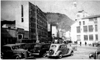
Imagen 4. San Victorino, 1947