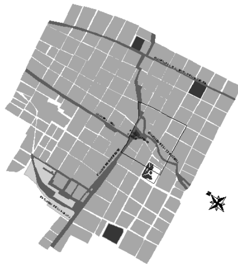
Imagen 3. Esquema de San Victorino, 1900

El crecimiento de la ciudad y la creación de nuevas economías representadas en el comercio de la plaza de San Victorino, impulsaron grandes dinámicas demográficas de crecimiento poblacional dentro del sector.