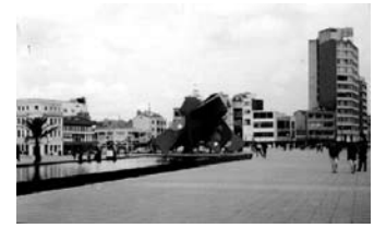
Imagen 8. Plaza Antonio Nariño vista desde la Avenida Jiménez

Las actividades que ha albergado San Victorino a través de su historia están en la memoria colectiva de todos los bogotanos. La vocación comercial del sector, la imagen