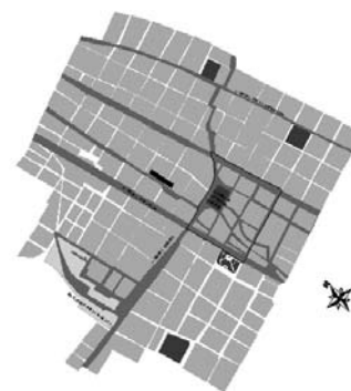
Imagen 7. Esquema de San Victorino, 1981

Por la cercanía de la calle de “El cartucho”, San Victorino fue relacionado con una imagen negativa de zona en deterioro físico y social. Los bogotanos que frecuentemente se dirigían a este sector a realizar sus compras consideraban a San Victorino uno de los lugares más peligrosos de la ciudad. Debido a la descomposición social y a la imagen de territorio vedado que generaba el sector de El Cartucho, San Victorino se relacionó con un “territorio del miedo, lugar de bandidos, drogadicción y prostitutas”. Investigaciones recientes sobre “el miedo en Bogotá” han hecho posible documentar estadísticamente la imagen que tienen los ciudadanos sobre diferentes lugares de la ciudad; dentro de estos registros aparecen San Victorino y El Cartucho asociados con los conceptos de inseguridad y degradación social 2 :