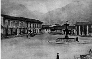
Imagen 2. Plaza de San Victorino, 1898.