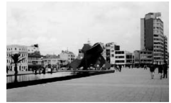
Imagen 1. San Victorino, 2001

Para este período, San Victorino se puede resumir en dos imágenes características: inicialmente como puerta de entrada de la ciudad por estar contiguo al núcleo fundacional, y luego como un sector comercial favorecido por su posición estratégica dentro de la ciudad.