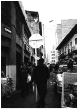
Imagen 6. Invasión del espacio público por el vendedor ambulante Esquina de calle 11 con carrera 11