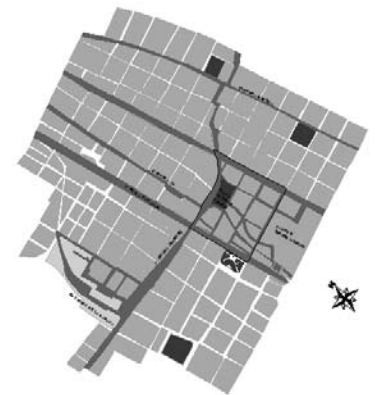
Imagen 9. Esquema de San Victorino, 2001.

Para este período, San Victorino se ha consolidado dentro de los límites de la carrera 10 y la avenida Caracas. A través de la avenida Jiménez se ha extendido la ciudad hacia el occidente y sigue siendo uno de los ejes de comunicación entre Bogotá y la región. La Estación de la Sabana ha perdido importancia por el fuerte desarrollo de rutas transportadoras que para este período salen desde La Terminal de Transporte y se conectan a la Avenida Jiménez a la altura de la avenida Boyacá. La carrera 13 funciona como vía de acceso vehicular a San Victorino y la plaza Antonio Nariño se renovó desalojando a los vendedores ambulantes que la invadieron. La zona del cartucho fue demolida y ahora es el nuevo parque Tercer Milenio.