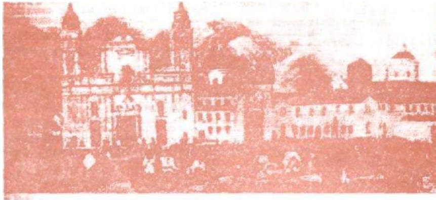
Reminiscencias. Santa Fe de Bogotá. Plaza de Bolívar

En Colombia éste concepto, aunque no definido explícitamente como tal, se presenta en el marco de las relaciones mercantilistas de producción en la Colonia