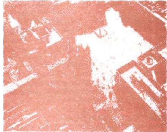
Plaza de Bolívar vista desde el aire

Como el espacio para el intercambio, se constituye en realidad en el instrumento más elaborado y necesario para el soporte de las relaciones de mercado. De hecho, la comunicación asociada con la accesibilidad, son requisitos básicos de su actual función, papel que de otro modo es desplazado de la esfera de los intereses y el dominio privado al dominio público, ya que por su naturaleza, la propiedad privada es restrictiva en relación a esta función.